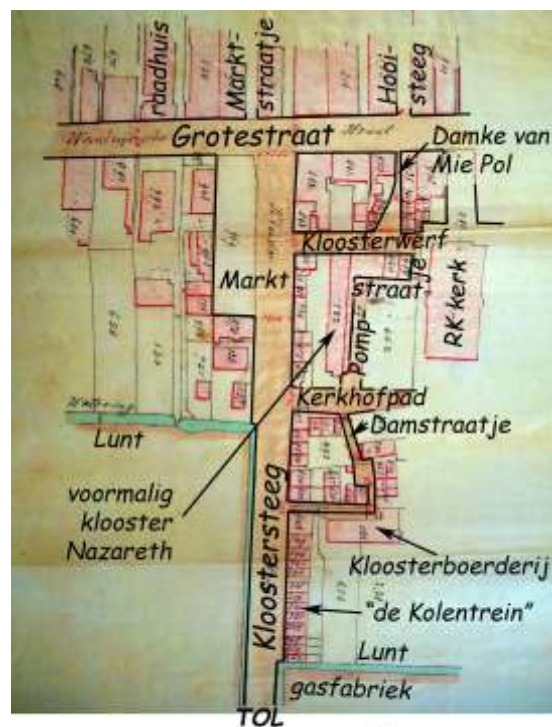
1878: Markt en omgeving

De aansluiting van de Kloostersteeg met de Grotestraat was een T- aansluiting. Met het drukker worden van de veemarkten in Waalwijk werd in 1866 een marktplein aangelegd. Dat kon door aankoop en sloop van het café van de weduwe van Adrianus Kemmeren dat op de westelijke hoek van die aansluiting stond. In eerste instantie was het plein nog onverhard, wat afhankelijk van het seizoen tot klachten over opwaaierend zand of modder leidde. Vijf jaar later werd de Markt bestraat.